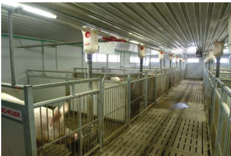
Odjeljak za nerasta, farma