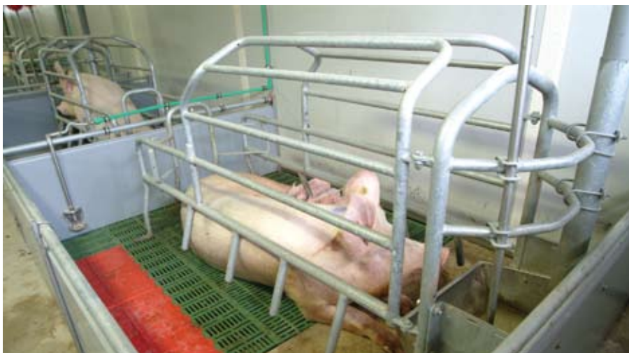
Odjeljak za prasenje

8.3. Krmačama i nazimicama treba biti omogućen materijal kojim će se zanimati, kao npr. slama ili drugi materijal odnosno predmeti za zadovoljenje njihovih etoloških potreba radi sprečavanja grizenja repova i drugih poremećaja ponašanja.