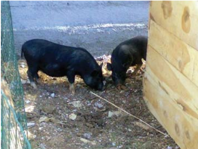
Minijaturna vijetnamska svinja