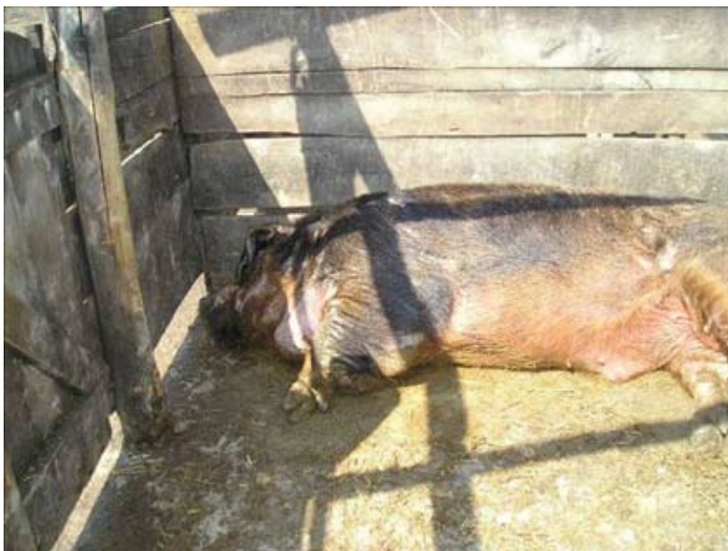
Odjeljak za nerasta, gospodarstvo