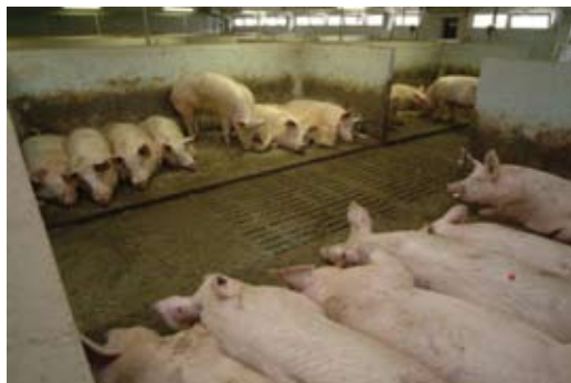
Držanje krmača i nazimica u skupinama

3.2. Kod skupnog držanja do pet svinja bar jedna strana treba biti duža od 2,4 m.