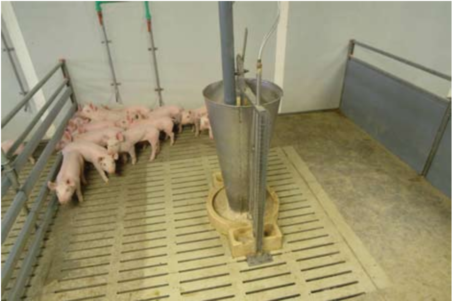
Tovljenici u intenzivnoj proizvodnji