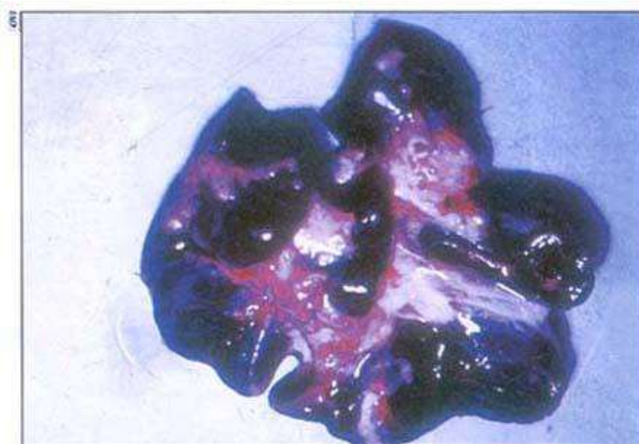
Slika 8. Hemoragični mezenterijalni limfni čvorovi