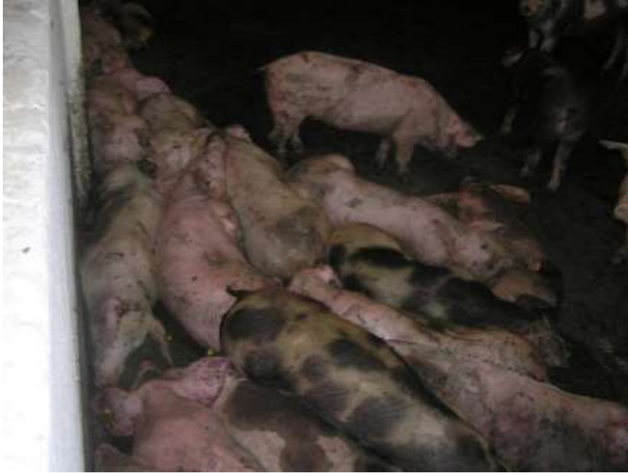
Slika 2. Svinje se nakupljaju u skupine

Svinje su nekoordinirane u kretanju i nakupljaju se u skupine. Krmače mogu pobaciti u svim stadijima gravidnosti. Kod nekih svinja može doći do povraćanja i opstipacije, dok se kod nekih može razviti krvavi proljev. Javljaju se vidljiva potkožna krvarenja, posebno na ekstremitetima i uškama. Prije smrti može doći do kome, koja se javlja jedan do sedam dana nakon pojave kliničkih znakova.