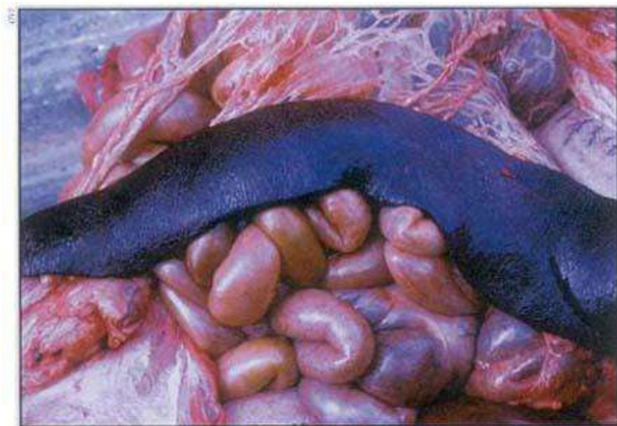
Slika 7. Tamna i povećana slezena