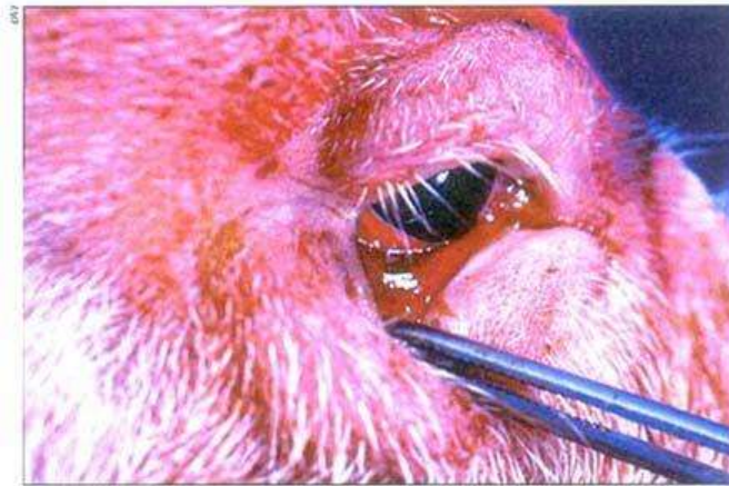
Slika 1. Kongestija i hemoragije mukoznih membrana na očiju

Prvi klinički znak bolesti obično je visoka tjelesna temperatura (više od 40°C), praćena depresijom, gubitkom apetita, brzim i teškim disanjem, te iscjetkom iz nosa i očiju.