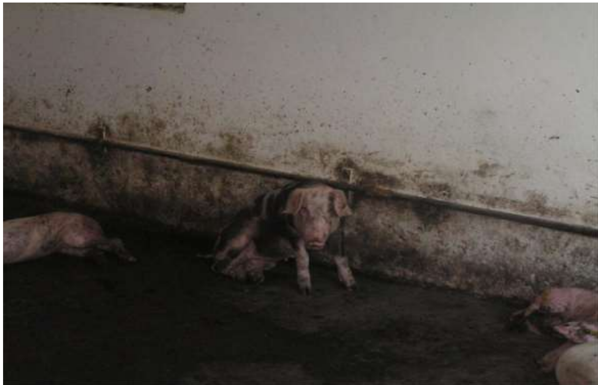
Slika 4. Otežano kretanje