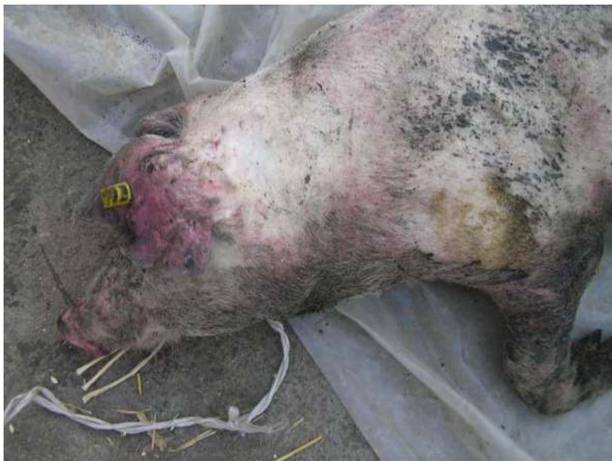
Slika 5. Potkožna krvarenja po uškama i ekstremitetima