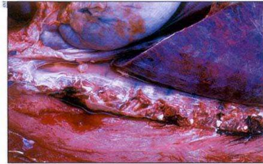
Slika 6. Nakupljanje krvave tekućine u tjelesnim šupljinama

Patoanatomski nalazi pokazuju tipičan hemoragijski sindrom s općom kongestijom trupa, nakupljanjem krvi u prsnoj i trbušnoj šupljini, povećanom tamnom slezenom, hemoragičnim limfnim čvorovima koji nalikuju ugrušcima krvi, posebno bubrežni i gastrohepatični limfni čvorovi, petehijalnim krvarenjima po bubrezima (kortikalnim i medularnim piramidama i bubrežnoj nakapnici), serozi abdomena, sluznici želuca i crijeva i srcu (epikard i endokard), hidrotoraksom i petehijama po pleuri.